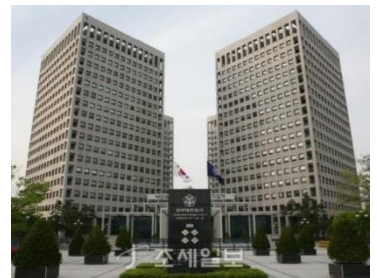
*사진 출처: 조세일보