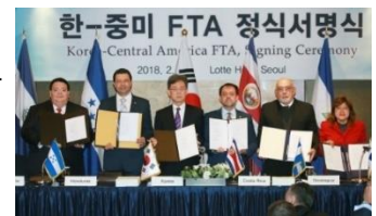
*사진 출처: 여성소비자신문